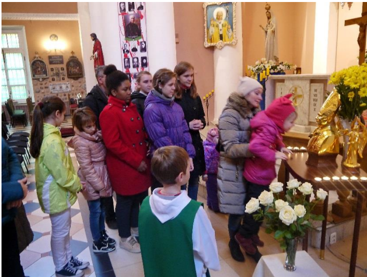
Реликвии св. Иоанна Павла II в храме св. Станислава и на улицы Санкт-Петербурга.