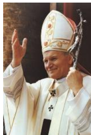
Св. Иоанн Павел II

Чтобы понять масштаб изменений в этот период, необходимо вспомнить, как выглядели Европа и мир, когда 16 октября 1978 года начался понтификат Иоанна Павла II. Мир тогда был прочно разделен на два политических блока, противостоящих друг другу в политической, военной и идеологической областях: подчиненный влиянию Москвы коммунистический Восток и Запад, в котором позицию лидера занимали Соединенные Штаты. Церковь в коммунистических странах подвергалась преследованиям. Только в Польше благодаря позиции миллионов верующих и мудрой политике иерархов под руководством Примаesa Польши кардинала Стефана Вышинского удалось сохранить основы религиозной свободы, хотя и здесь Церковь была лишена юридического лица, не было также дипломатических отношений между ПНР и Святым Престолом.