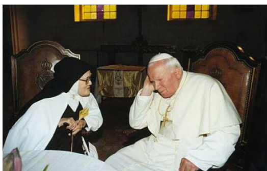
Св. Иоанн Павел II и сестра Лусия Сантуш из Фатимы